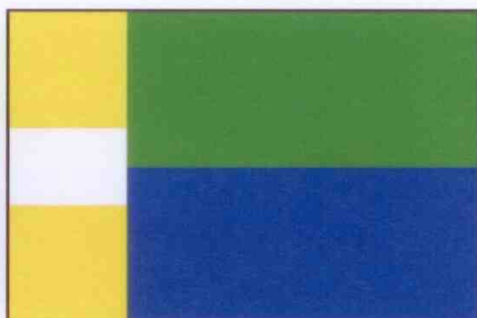
NÁVRH Č. 4