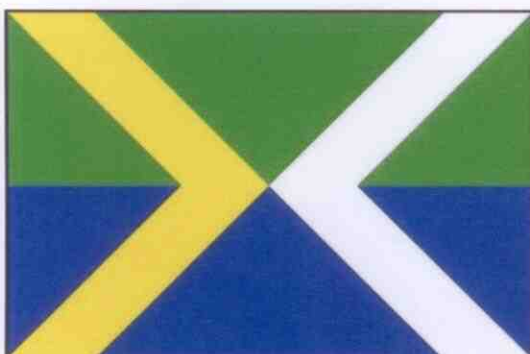
NÁVRH Č. 3