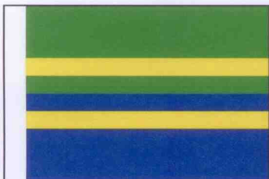
NÁVRH Č. 5